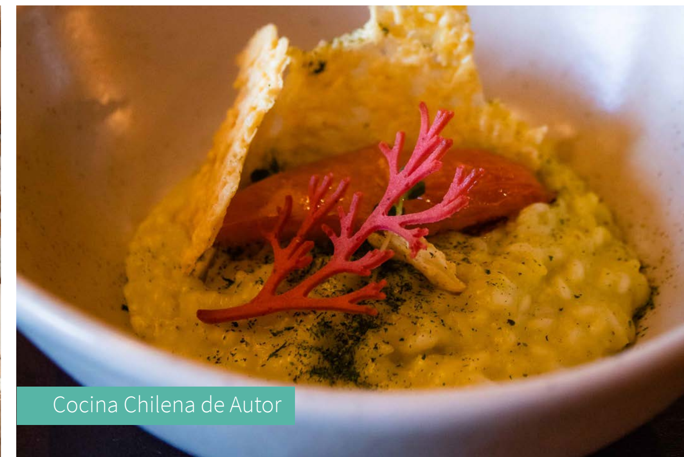
Cocina Chilena de Autor