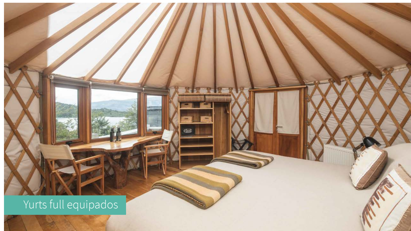
Yurts full equipados