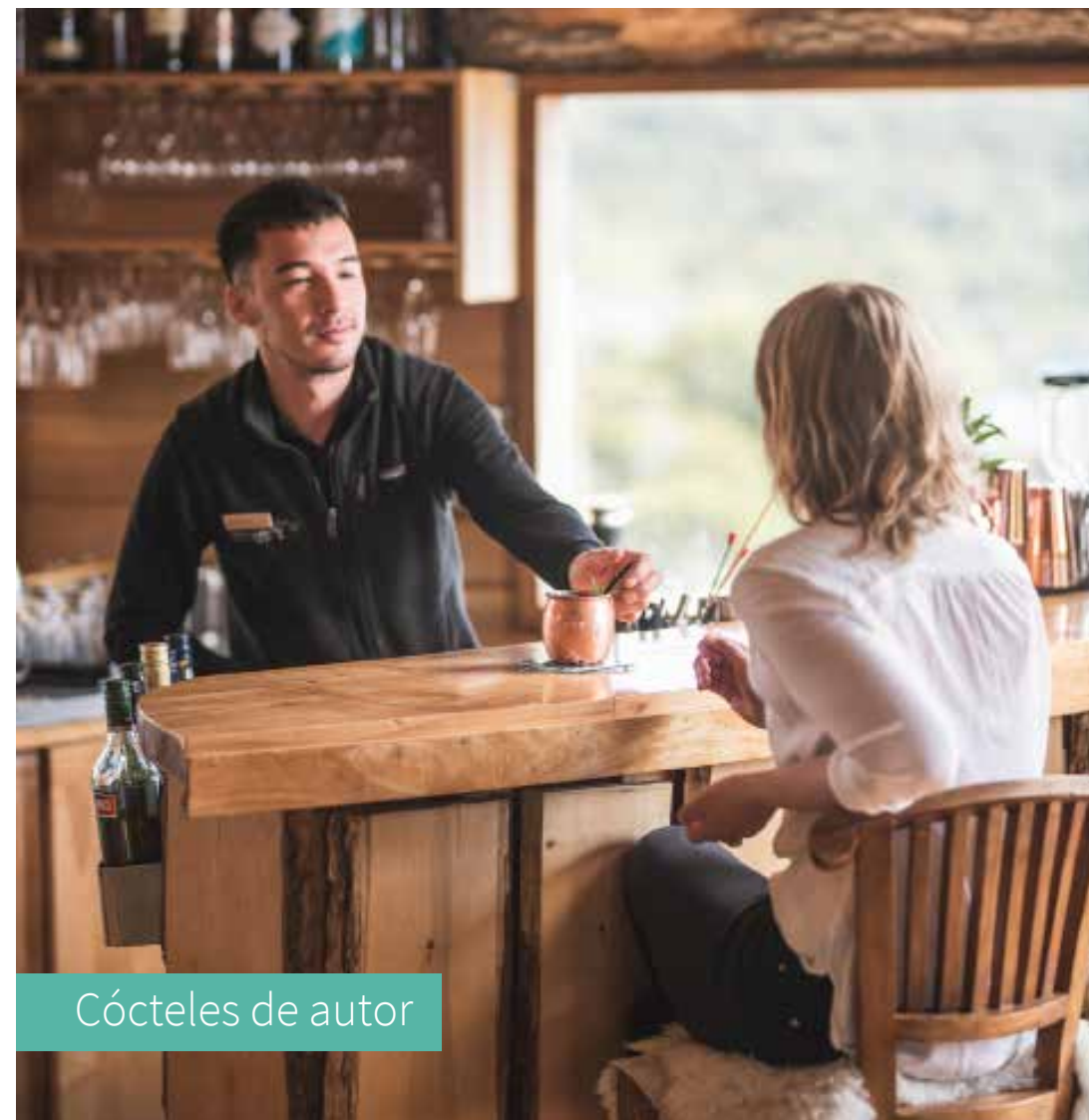
Cócteles de autor