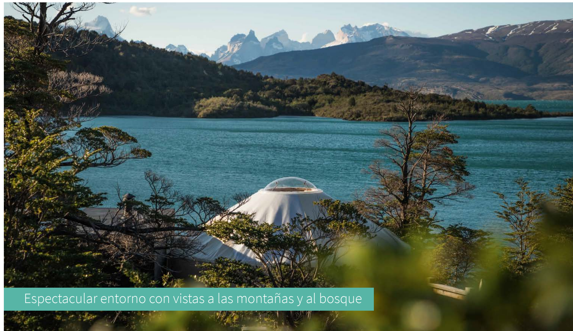
Espectacular entorno con vistas a las montañas y al bosque