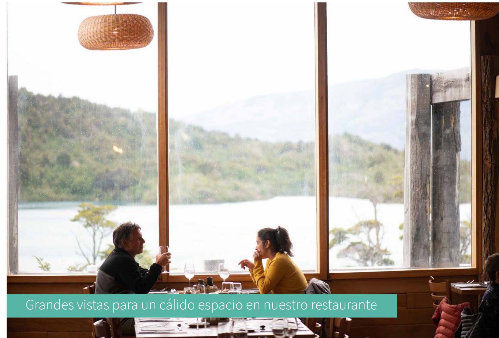
Grandes vistas para un cálido espacio en nuestro restaurante